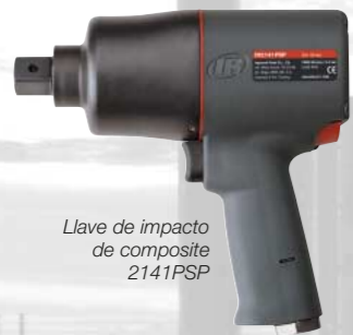
Llave de impacto de composite 2141PSP