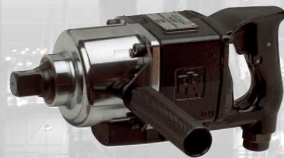
Llaves de impacto con aleación 2934B2SP