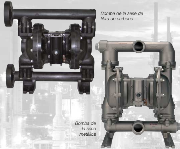
Bomba de la serie de fibra de carbono